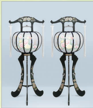
B-1 あかね 高さ93cm 1対 19,800円 (税込)