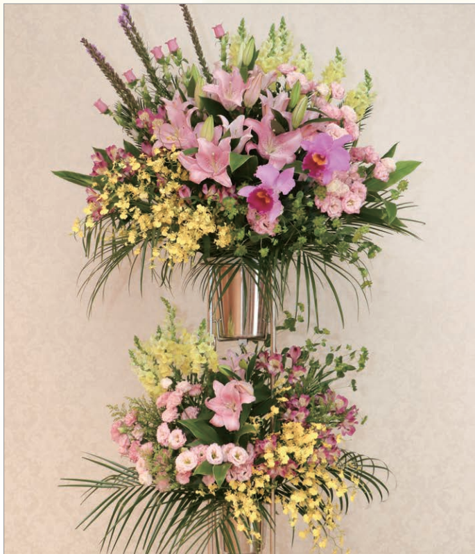
F-3 スタンド洋花 2段

輪菊・百合3種・カーネーション・アルストロメリア・SPマム・オレンジウム・デンファレ・かすみ草・季節花・カトレア (洋蘭)