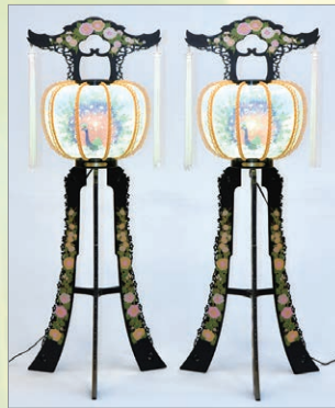
B-2 ひまわり1号 高さ115cm 1対 22,000円 (税込)