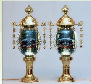
T-2 水明灯 高さ58cm 1対 24,200円 (税込)