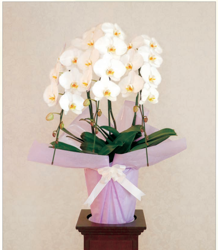
F-4 胡蝶蘭 3本立ち 33輪~36輪

季節の洋花を選定してお造りいたします。 スタンド生花よりひと回り大きいサイズとなります。 (輪菊は使用していません)