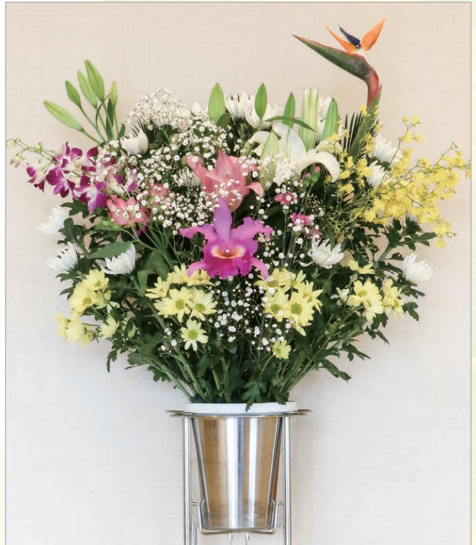
F-2 スタンド生花 1段

輪菊・百合3種・カーネーション・アルストロメリア・SPマム・オレンジウム・デンファレ