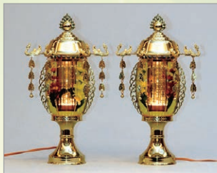
T-1 菊華灯 高さ40cm 1対 19,800円 (税込)