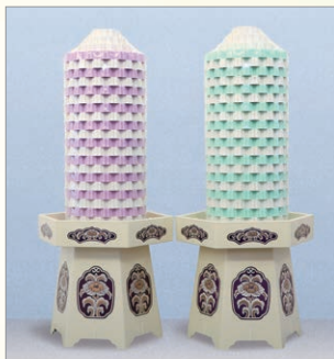
G-1 楽願塔* スティックシュガー 120本入り 高さ約62cm 1対 17,280円 (税込)