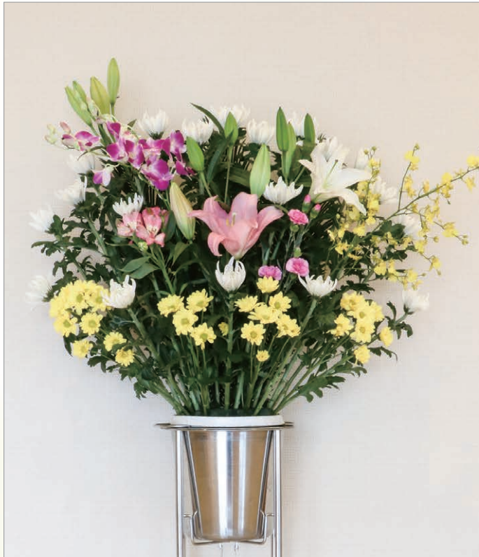
F-1 スタンド生花 1段