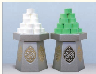
G-2 盛菓子* 上白糖 高さ約41cm 1対 8,640円 (税込)